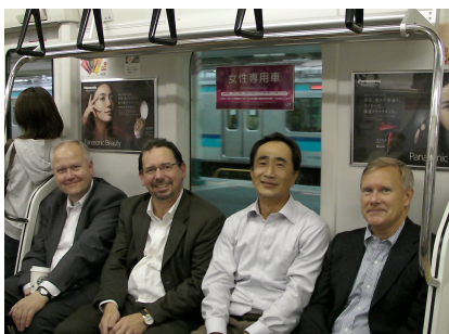
(四人で女性専用席に座っています。)

かったです。また、落語会ではさん喬師匠の「芝浜」を学生達に聞いてもらいました。（この話をアメリカ人に聞かせるのは私の夢だったので、それがついに実現したことになります。）秋には、パデュー大に新人の大学院生が四人入学してきました。