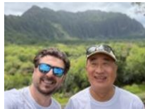
ホノルルでの学会発表