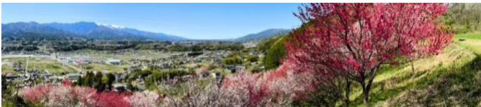
ハナモモ (長野県阿智村)

4月末には花桃を見に再び信州に行きました。花桃は白、ピンク、赤の様々な花を咲かせる桃の木で、桜ほど知られていませんが、丘いっぱいに咲く花桃の景色は圧巻です。このときは中央高速をたくさん走り駒ヶ岳ロープウェイや奈良井宿にも寄りました。駒ヶ岳は標高2610mで、山頂はまだ雪で覆われていましたが、日本で一番高い3つの山が見えます。奈良井宿は江戸時代の宿場町で、今は外国人にとっても人気のある観光地になっています。