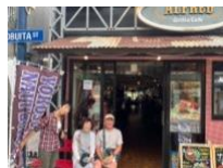
横須賀ドブ板通り