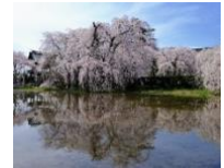
安養寺の枝垂れ桜

4月末には花桃を見に再び信州に行きました。花桃は白、ピンク、赤の様々な花を咲かせる桃の木で、桜ほど知られていませんが、丘いっぱいに咲く花桃の景色は圧巻です。このときは中央高速をたくさん走り駒ヶ岳ロープウェイや奈良井宿にも寄りました。駒ヶ岳は標高2610mで、山頂はまだ雪で覆われていましたが、日本で一番高い3つの山が見えます。奈良井宿は江戸時代の宿場町で、今は外国人にとっても人気のある観光地になっています。